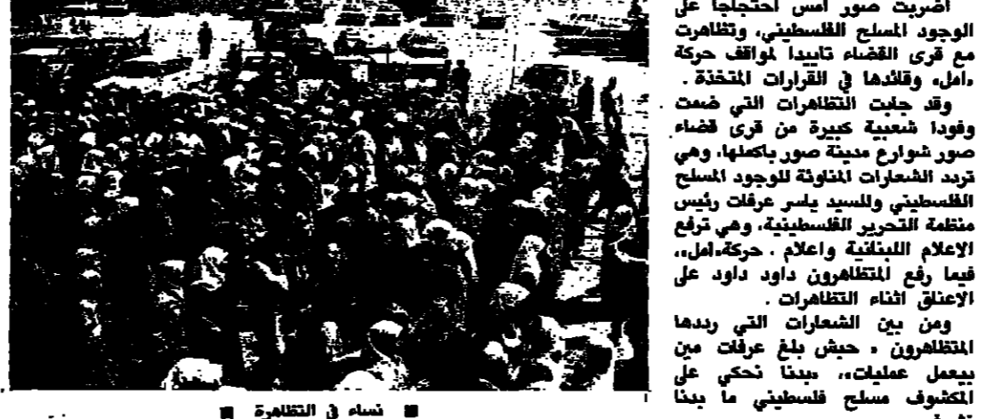
شاه في التظاهرة

صور - من تزيه تقوي: اضريت صور امس احتجاجا على الوجود المسلح الفلسطيني، وتظاهرت مع قوى القضاء تابعا لوائف حركة امل، وقلتها في القرارات المتخذة. وقد جابت شعبية كبيرة من قري قضاء وفودا شعبية كبيرة من قري قضاء صور شوارع مدينة صور بكاملها، وهي تزداد التظاهرات للوجود المسلح الفلسطيني والسيد يسر عرفات رئيس منظمة التحرير الفلسطينية، وهي ترفع الاعلام اللبنانية واعلام حركة امل، فيما رفع المتظاهرون داود داود على الاصق انشاء التظاهرات. ومن بين الشعارات التي رددتها المتظاهرون - حيا بلع عرفات من يعمل عميل، سينا نحكي على اكتشف مسلح فلسطيني ما بينا نتشرف. وقد شارك في التظاهرات نساء وفتيات وجابت كافة شوارع صور، وانتهت بكرة من السيد داود داود أكد فيها على استمرار النهج الذي خطته حركة امل، بمنع العودة الى ما قبل العام ١٩٨٢، وشهدا على ان الاجراءات ستستمر لمنع اية تجاوزات بحق المواطنين. وقد شلت الحركة كلها امس في مدينة صور بعدما شاركت المؤسسات الرسمية والخاصة والمكاتب التجارية والمدارس والمكاتب في الاضراب العام. وشلت الحركة في ليدية الضميمة بقلية للغة نفسها بعد ان عطلت الاجمال احتجاجا. هذا وكانت حركة امل، قد عمدت خلال الايام الماضية الى تخفيف حواجزها على الطريق السلطانية واستتقت فقط على اربعة حواجز للتحقق، فيما دفعت بمزيد من التعزيزات الى المناطق الجنوبية المتاخمة للقري التي تستقر بالمشابج الجيش الاسرائيلي منها وذلك للعمل على تأمين الحماية لها. في هذا الوقت، وهدت قوات الجيش الجنوبي قصف قري جباع، جروج وعرب صالحين من مواقعها في جبل صافي، ومزرعة مسجد، وقد اوقع القصف اضرارا مادية في المتكاتب قضية جزين وبالنسبة لقضية جزين، فقد تحدثت